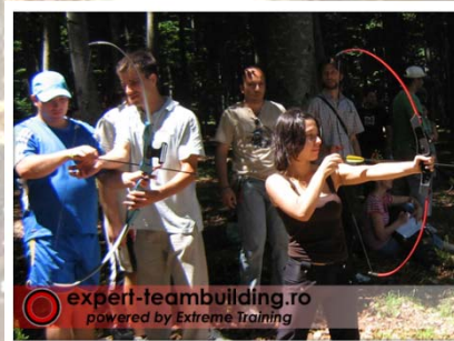
Tir cu arcul