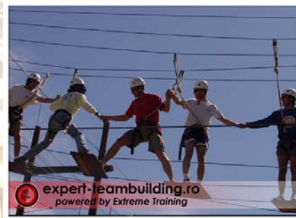
Traseu de franghii